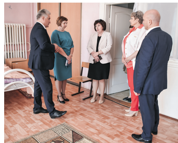
В школе-интернате м-на Ивдель-3