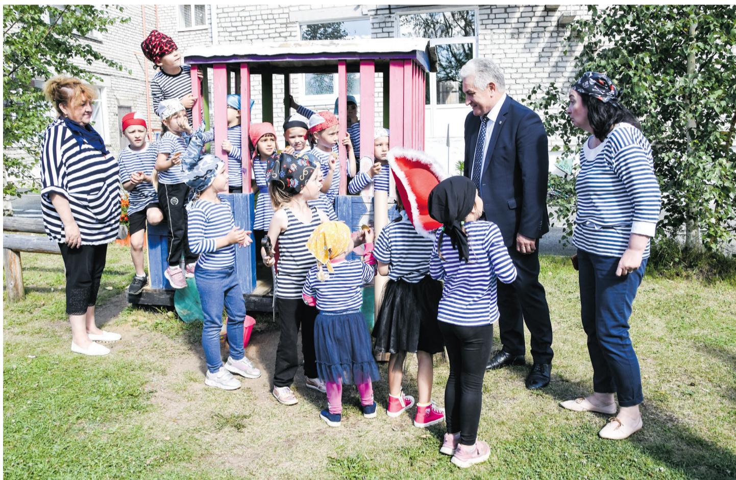
Ю. И. Биктуганов в детском саду № 2

Министр рассказал, что с 1 сентября в более 800 образовательных организациях откроются центры детских инициатив и появятся советники директора по воспитанию и взаимодействию с детскими общественными объединениями. Кстати,