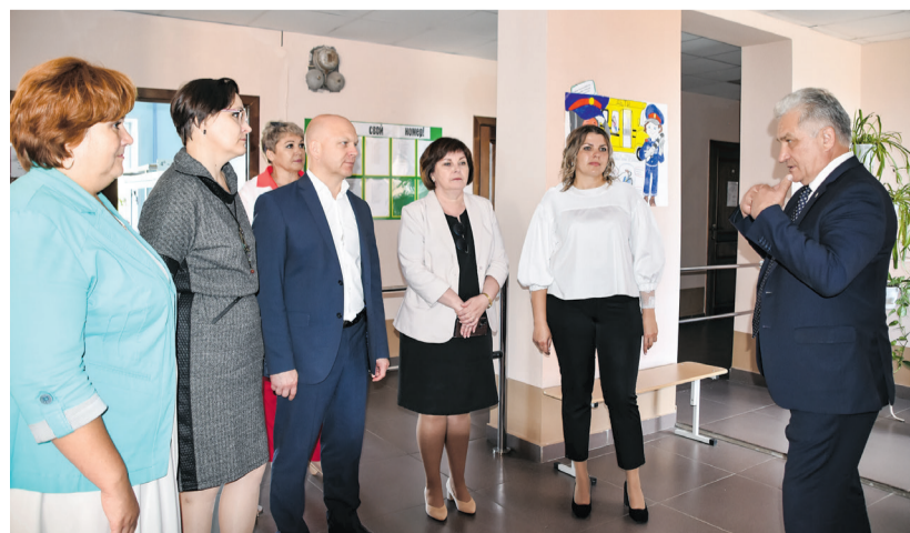
В школе № 3 п. Полуночное