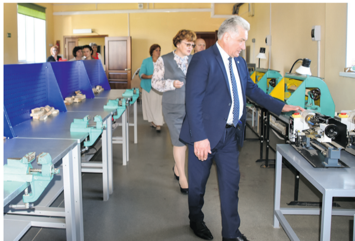
Мастерские в школе № 1