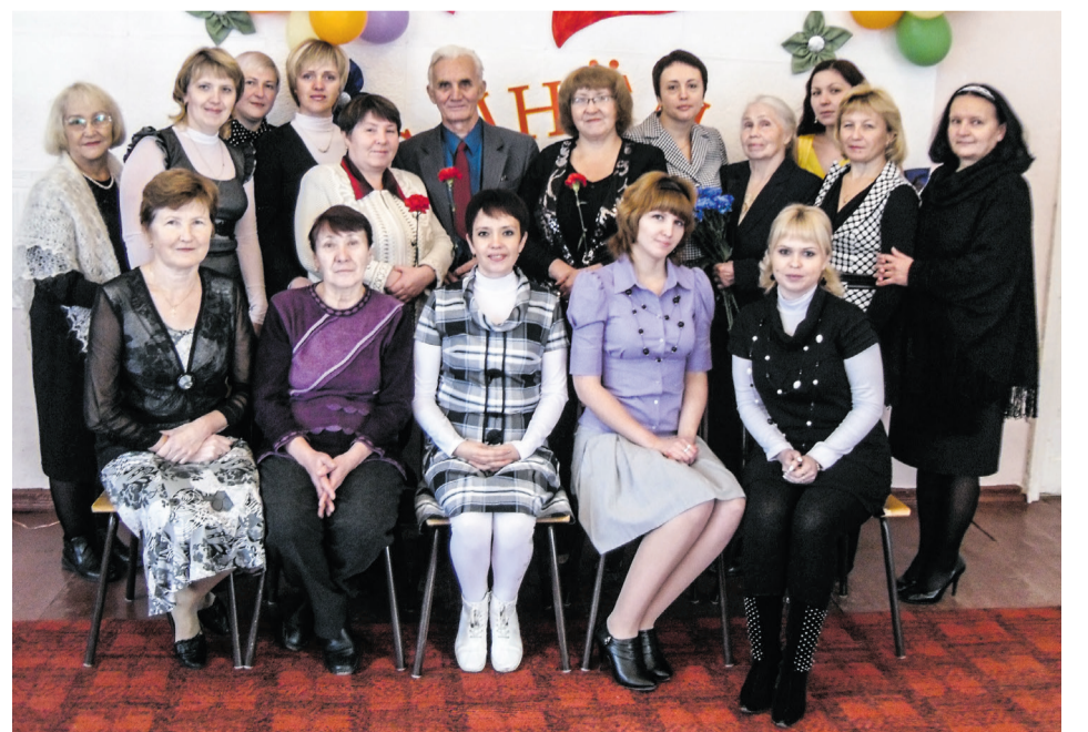
Школа № 28 – конец 2010 г.