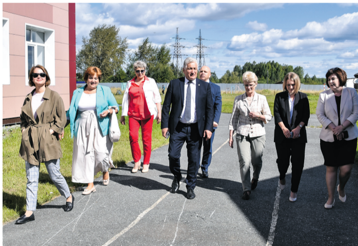
В школе № 2