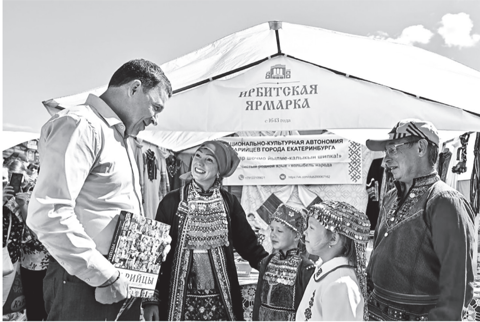
Евгений Куйвашев на ярмарке в Ирбите

Свердловская область — регион с богатой историей и культурным наследием, которое поддерживают и развивают энтузиасты-патриоты родного края. Яркий пример — Ирбит, которому почти 400 лет и который до сих пор известен на всю Россию, в том числе благодаря неравнодушным местным жителям. Губернатор посетил главное туристическое событие города — Ирбитскую ярмарку. Своим примером он призвал уральцев больше путешествовать по Свердловской области. На Урале множество перспективных направлений для туризма: промышленного, природного, гастрономического, культурного и делового. Евгений Куйвашев поддерживает развитие туризма у нас в области, ведет активные переговоры с Ростуризмом по его финансированию. Со временем губернатор намерен сделать регион привлекательной туристической точкой на карте России.