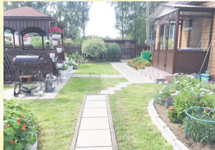
Н. Пяткова «Мой маленький дворик»

Мы ждем новых работ! Не забывайте, что победителей и призеров конкурса ждут ценные призы, которые будут полезны каждому мастеру садоводства!