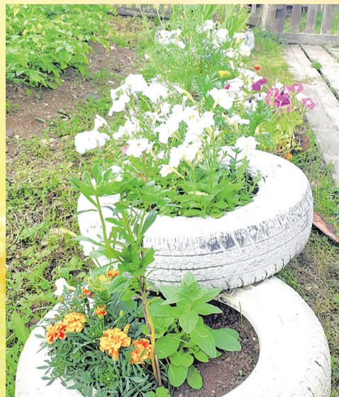
«Эксклюзивная клумба» Е. Томенко