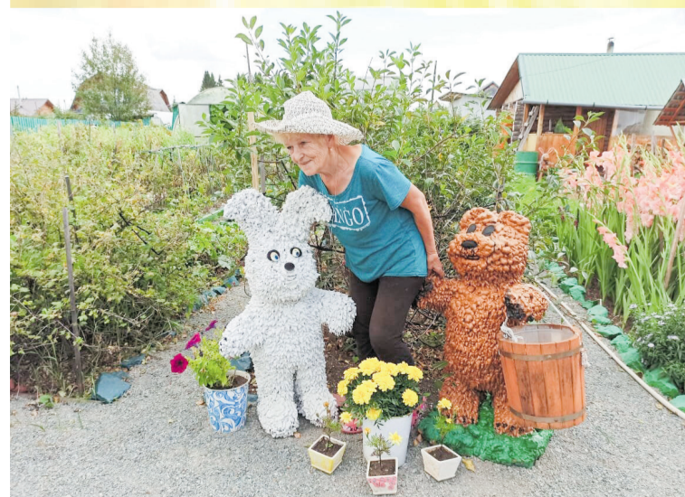
В. Черкашина «Мой маленький дворик»