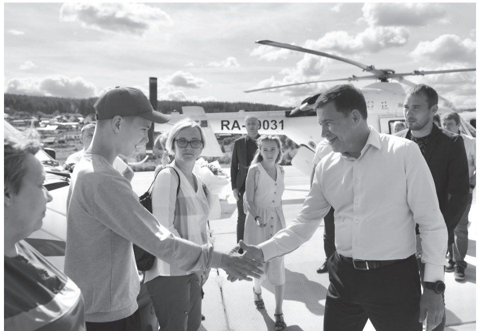
Е. Куйвашев на открытии вертолетной площадки

Но лечат не стены, не техника, а врачи. Сегодня в целом северный округ укомплектован врачами и средним медперсоналом на 83 про-