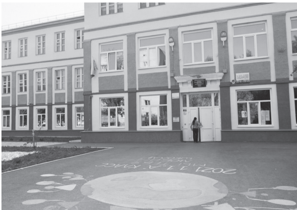
Школа № 3 г. Камышлов

Но мало направить и привлечь сюда людей, нужно ещё и закрепить их на местах. Тем, кто приезжает трудиться в местные больницы, будут предоставлены единовременные выплаты: до 1,5 миллиона рублей врачам и 750 тысяч рублей — фельдшерам.