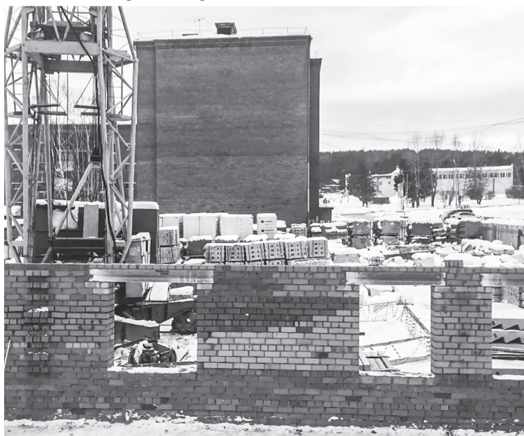
На улице Механошина