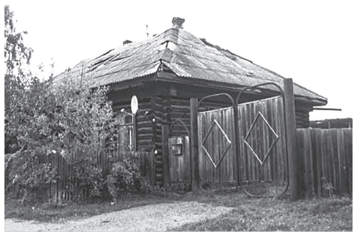
В этом доме на ул. Ленина начинал работать военкомат

Галина РАЛЬНИКОВА По материалам газеты «Северная звезда»