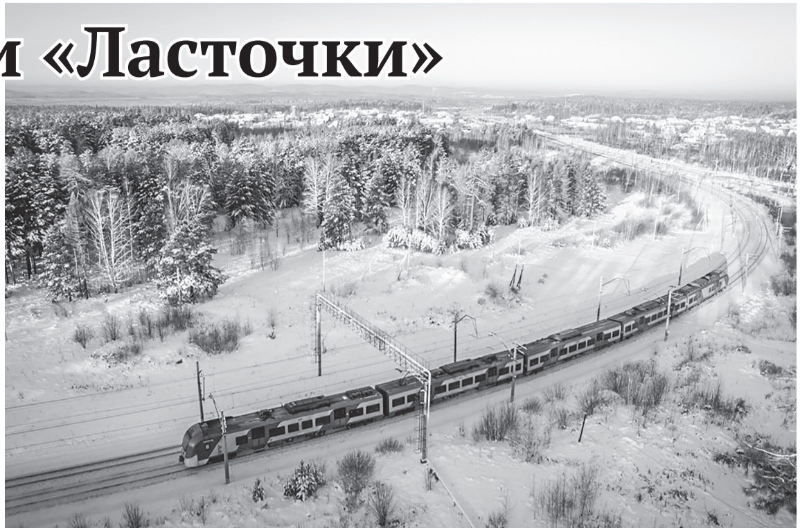
Электропоезд «Ласточка» в пути

В «Ласточке» есть все для комфортной поездки: каждый вагон оборудован климатической установкой с системой фильтрации воздуха, в салоне есть розетки для подзарядки мобильных