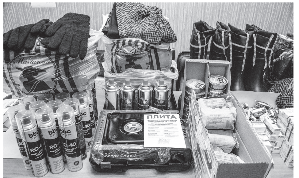
Для наших мобилизованных бойцов

Тамара Ивановна Деньговская с оптимизмом, присущему человеку, безгранично верящему в нашу победу, рассказала, что приобретено на поступающие средства: «Мы, конечно, всегда стараемся приобрести то, что крайне необходимо, то, что нужно в первую очередь, без чего не обойтись. Это продукты питания, 20 комплектов термобелья, большое количество носков и перчаток, сапоги Чесла на