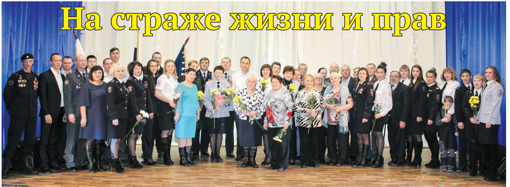
Ветераны и сотрудники МО МВД России «Ивдельский».

10 НОЯБРЯ – ДЕНЬ СОТРУДНИКА ОРГАНОВ ВНУТРЕННИХ ДЕЛ РФ