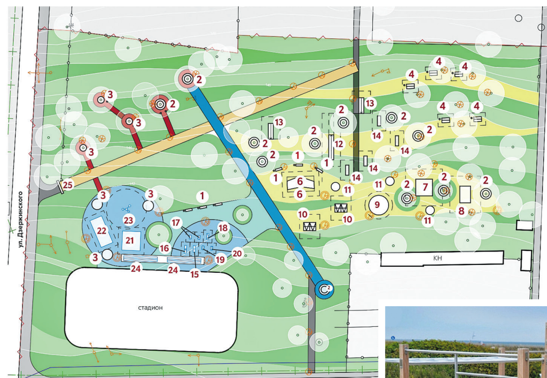
План благоустройства общественной территории "Кедровый парк по ул. Дзержинского"

Проектом благоустройства общественной территории, прилегающей к клубу "Химик" предусмотрено: устройство парковки для гостей клуба "Химик", а также жителей близстоящих многоквартирных домов, спортивная зона, включающая уста-