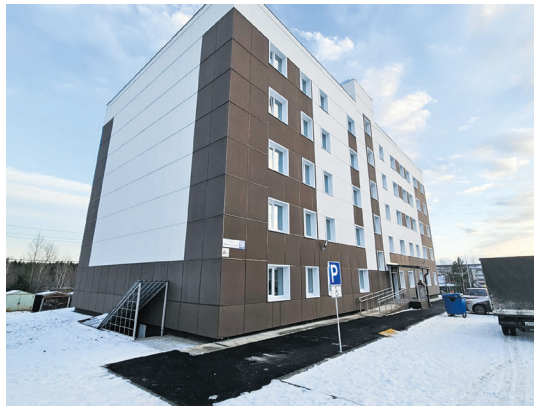
Вместо него вырос новый дом

Шестилетняя программа по расселению аварийных домов, признанных таковыми до 2017 года, рассчитана до сентября 2025 года. В программе участвуют 58 муниципалитетов. Благодаря ей, свыше 20 тысяч человек получат возможность переехать из домов, пришедших в негодность. Их общая площадь составляет 337,8 тысячи квадратных метров.