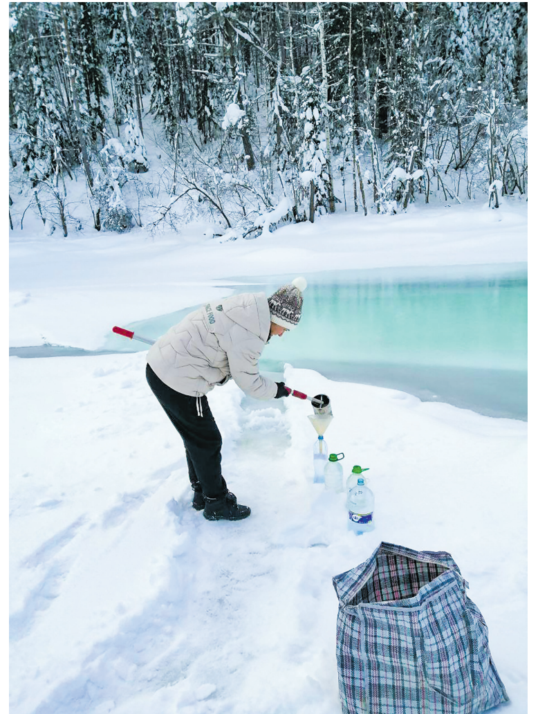
Отбор проб из р. Ивдель 18.01.2024 г.