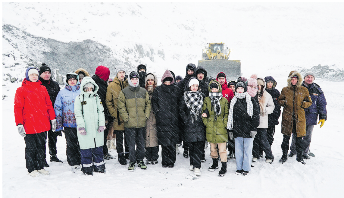
Студенты познакомились с работой карьера

Среди посетителей производственной площадки горнодобывающего подразделения – 25 будущих автомехаников, поваров и продавцов, учащихся I и II курсов.