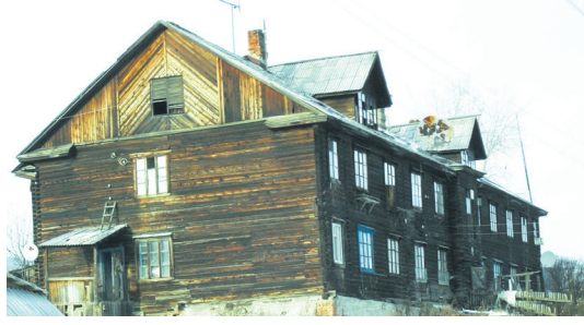
Этот дом по ул. Механошина сгорел

Всего на 2024 год объём финансирования программы расселения аварийного жилья составляет 2,9 миллиарда рублей. Из них 1,6 миллиарда рублей — это средства Фонда развития территорий, 1,3 миллиарда рублей — средства областного бюджета, ещё около 30 миллионов добавят муниципалитеты — участники программы.