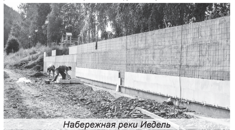
Набережная реки Ивдель

К выбору объектов для благоустройства привлекают жителей — так выбираются площадки, наиболее любимые горожанами и сельчанами. За первое полугодие 2022 года в различных формах голосования приняли участие более 900 тысяч человек. Свердловская область вошла в число лидеров по количеству проголосовавших за проекты по муниципальным программам — участвовали более 700 тысяч жителей, что на 42% превышает уровень прошлого года.