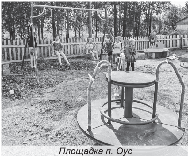
Площадка п. Оус

В четверг, 28 июля, губернатор смотрел парк и поучаствовал в презентации кино. В своей речи Евгений Куйвашев похвалил развитие парка, его проекты