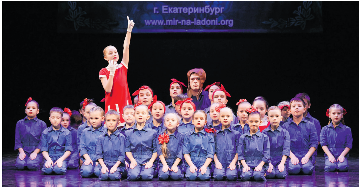
"Веснушки". Танец "От винта!"