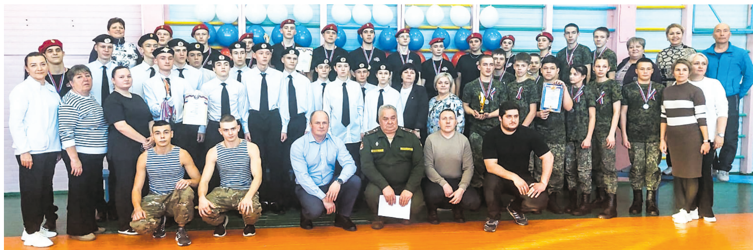
Участники муниципального этапа игры "Зарница"

Организовали военно-спортивную встречу ив-