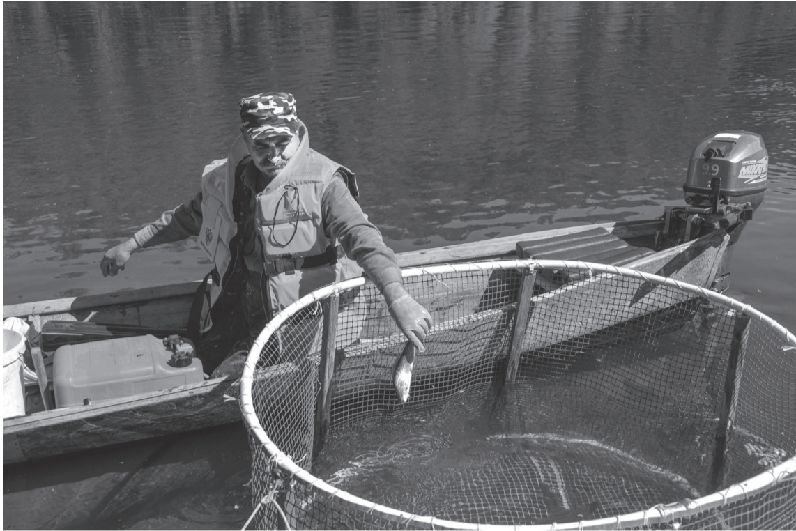
Вылов хариуса из р. Лозьва

«Святогор» приступил к реализации уникального проекта по воспроизводству ценного для северных рек Свердловской области вида рыб – хариуса.