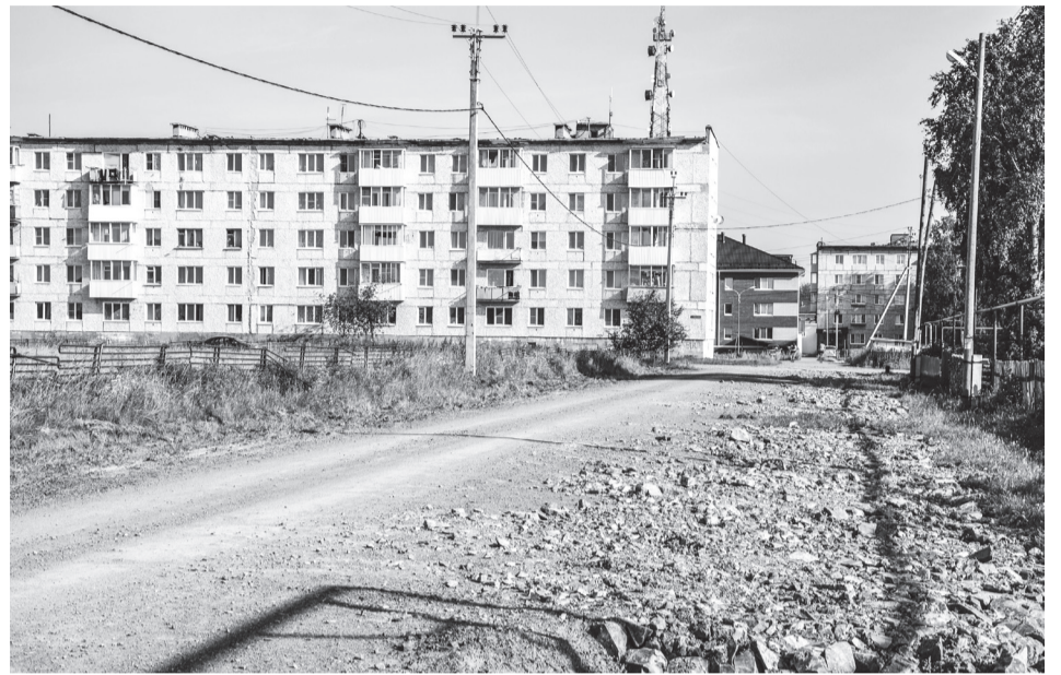
Ремонт улицы 50 лет Комсомола