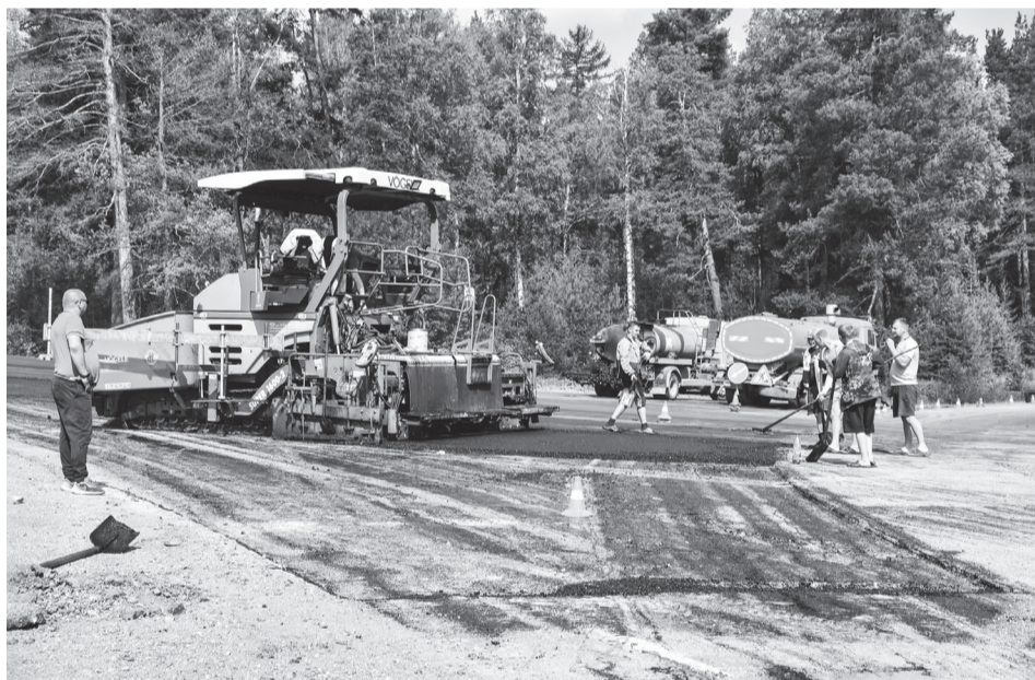
Идет асфальтирование перекрестка в м-не Ивдель-1