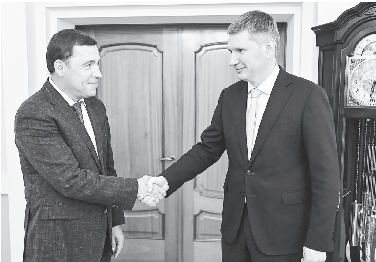
Максим Решетников назвал Средний Урал опорным регионом для экономики страны

Максим Решетников заявил, что правительство РФ рассчитывает на Свердловскую область