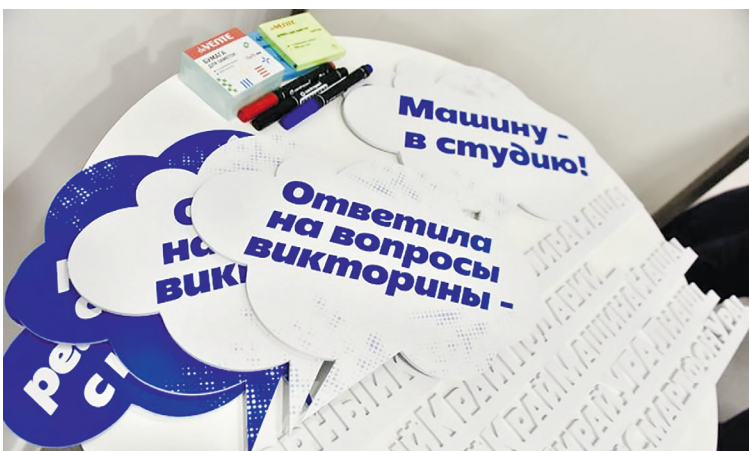
В пунктах выдачи для обладателей ценных подарков создается праздничное настроение: работает фото-зона, где обладатели подарков могут сфотографироваться с хэштегами