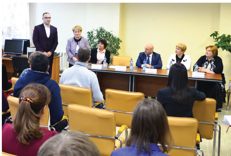
В городской библиотеке