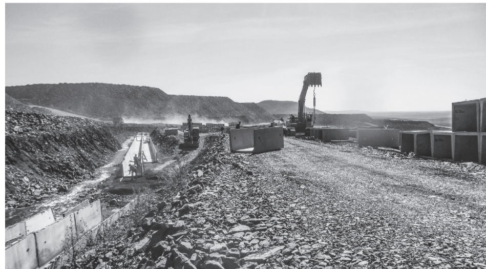
Работы по переносу р. Медвежий

– Закрытый вариант трассы отвода ручья Медвежий позволит исключить