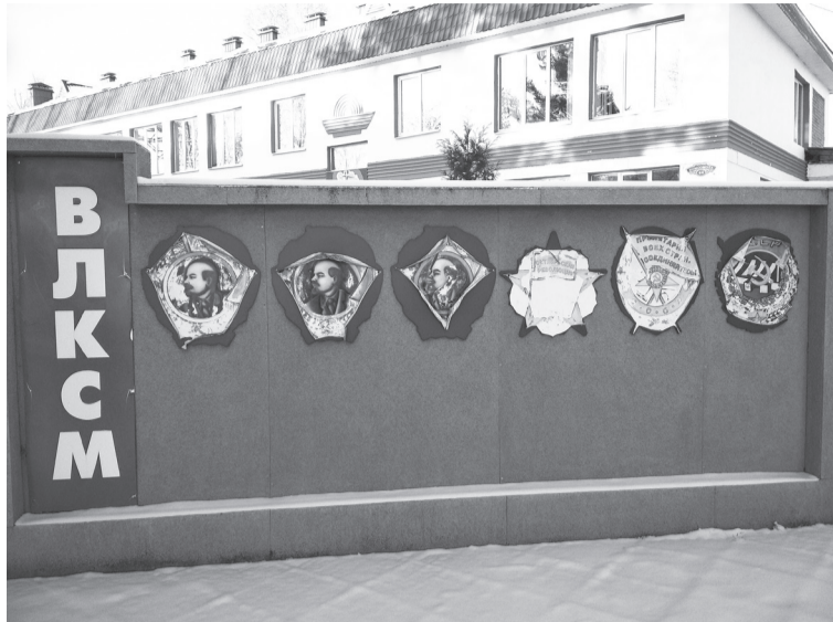
Ордена давно обветшали

«Прспект» - звучит гордо! Могучий дуб напротив магазина «Семья» (бывший «Юбилейный») помнит еще наших родителей. У здания полиции растут чудесные ели. Вдоль дороги аккуратные кустарники. Прекрасные здания: ЗАГС,