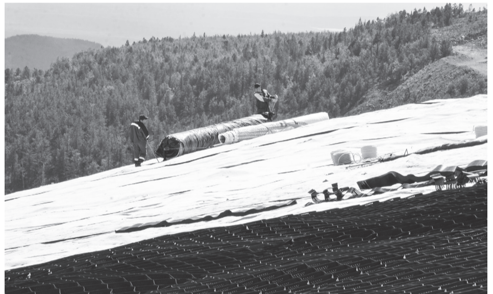
В 2022 году уже укрыты свыше 100 тысяч кв. м Шемурских отвалов

Затраты «Святогора» на выполнение данных экологически значимых мероприятий предусмотрены планом в сумме порядка 470 миллионов рублей.