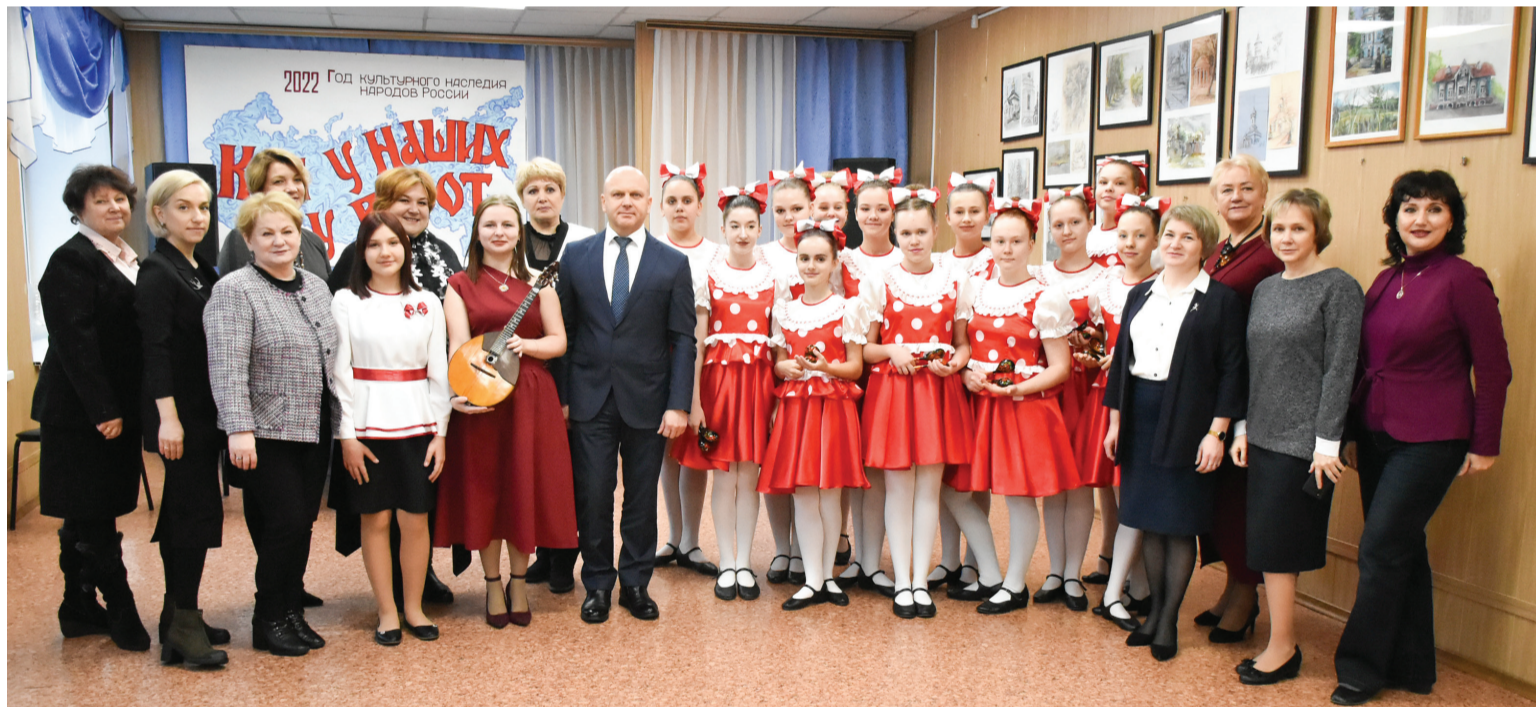
Министр культуры с педагогами и воспитанниками ДШИ