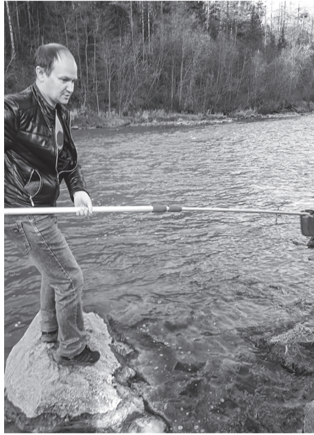
Очередной отбор проб воды р. Ивдель состоялся 12 октября 2022 года

Отбор проб ведется в месте водозабора из р. Ивдель – на входе на очистные сооружения, а также на выходе – из резервуаров чистой воды, расположенных на очистных сооружениях, т.е. перед подачей в систему водоснабжения города.