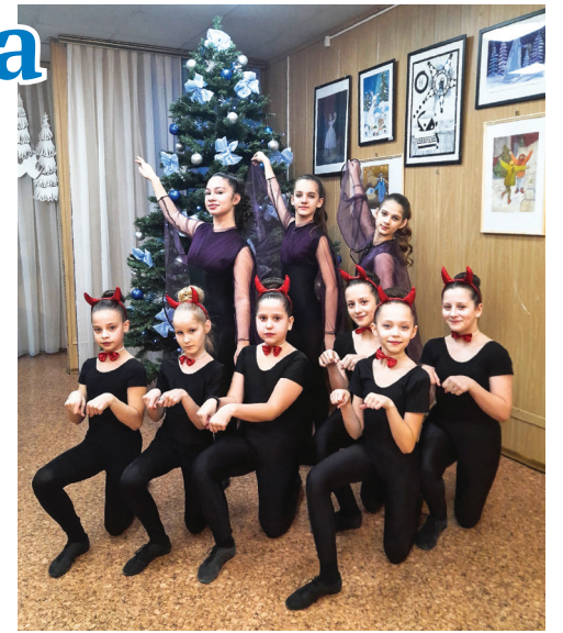
Ученицы отделения хореографического искусства