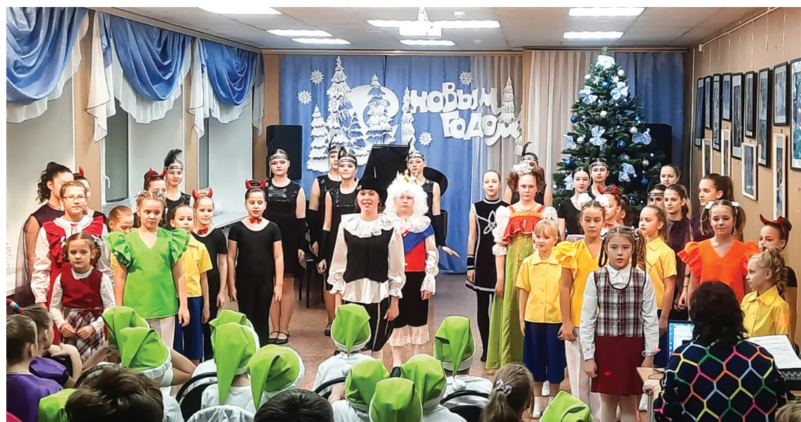
«В некотором царстве, в танцевальном государстве»