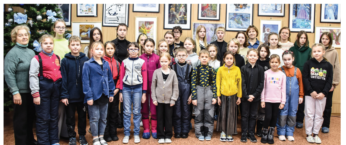
Педагоги и учащиеся отделения изобразительного искусства