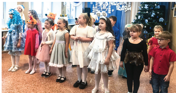
Отделение раннего эстетического развития

На суд величественных особ были представлены не только таланты танцевальные, но и музыкальные. Желающих попасть в танцевальную свиту Царя Гороха было несчитанное количество, один за другим учащиеся хорео-