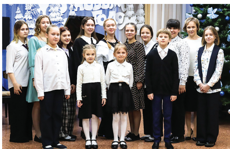
Концерт класса И.Н. Бакушевой

Е. УТАРБАЕВА, директор Ивдельской ДШИ