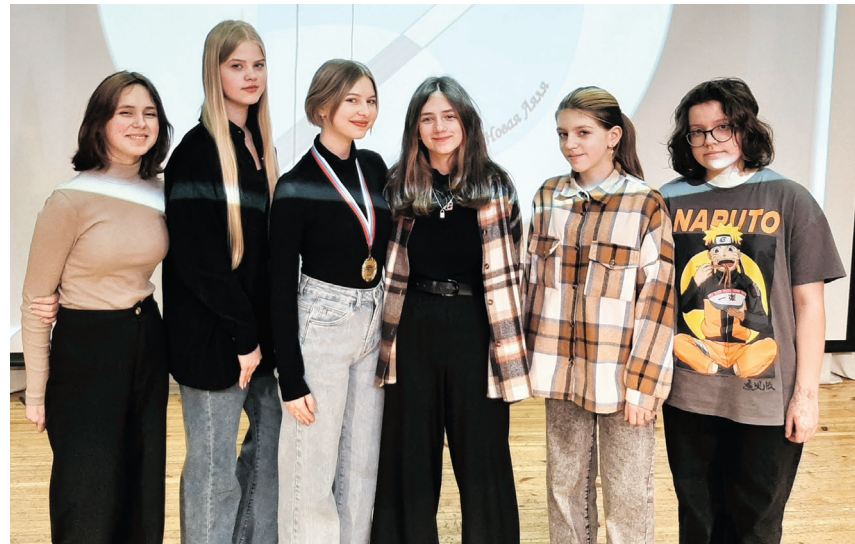
Участники и призер конкурса «Академия рисунка»

Уже совсем скоро завершится учебный год, наступит пора подведения итогов, выставления оценок, сдача экзаменов... Все это ждет учащихся Ивдельской школы искусств. Но прежде, чем подходить к результатам учебного процесса, мы решили рассказать о тех важных моментах конкурсной деятельности, которую педагоги и учащиеся школы искусств смогли проделать за последние месяцы.