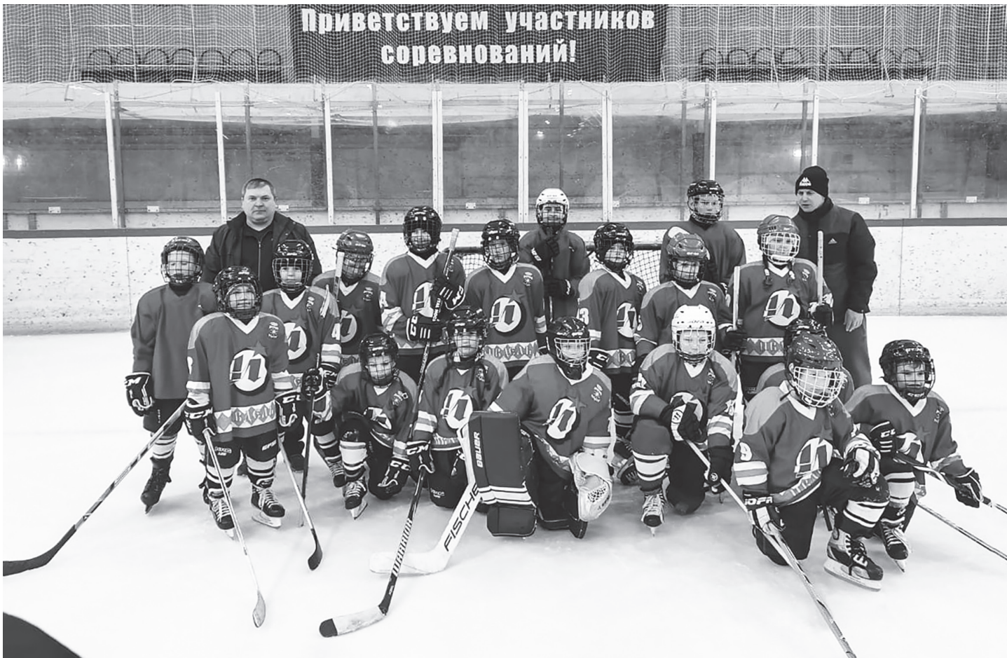
Ивдельчане в г. Югорске

Когда мы начали наши тренировки, ребятшек было совсем немного, но с