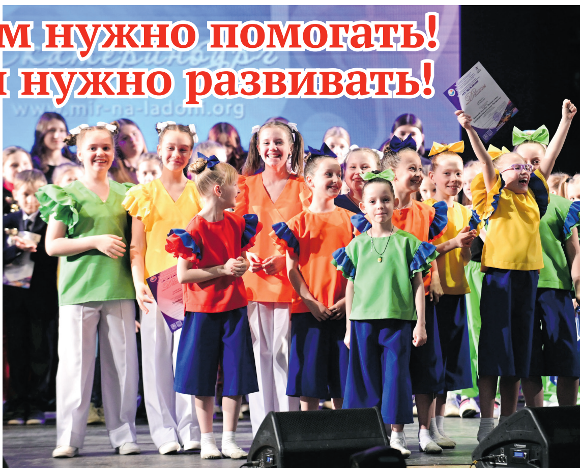
Вокальный ансамбль «Веселые нотки» и хореографический коллектив «Настроение»

Учащиеся художественного отделения Ивдельской школы искусств справились с данными