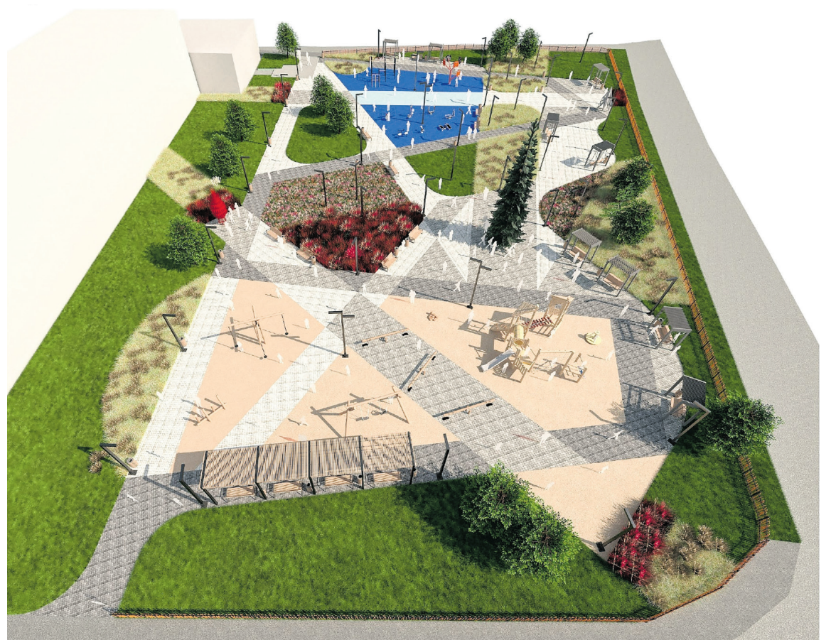
Дизайн-проект по объекту «Благоустройство общественной территории по ул. Пушкина в г. Ивдель»

В целях продолжения реализации вышеназванного проекта в 2024 году, приглашаю жителей Ивдельского округа принять активное