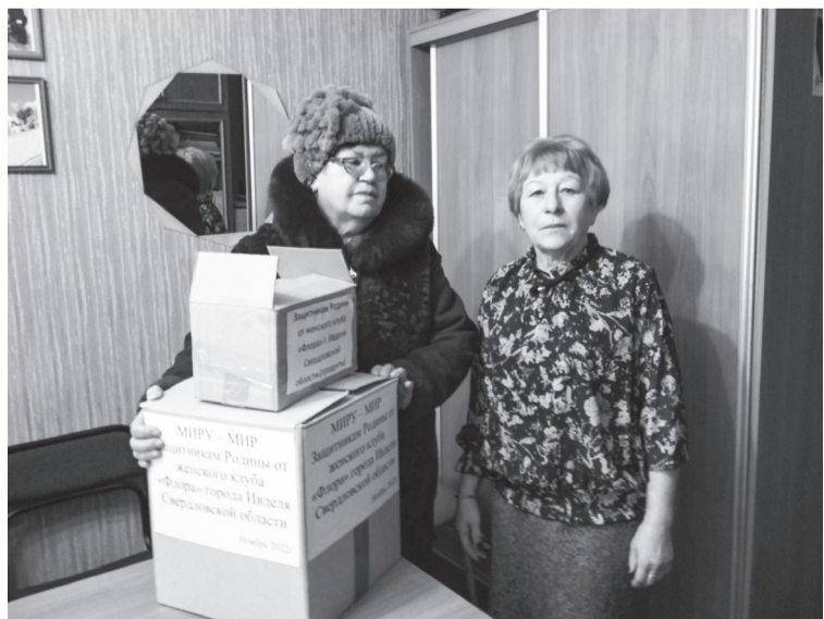
Посылки от клуба «Флора»