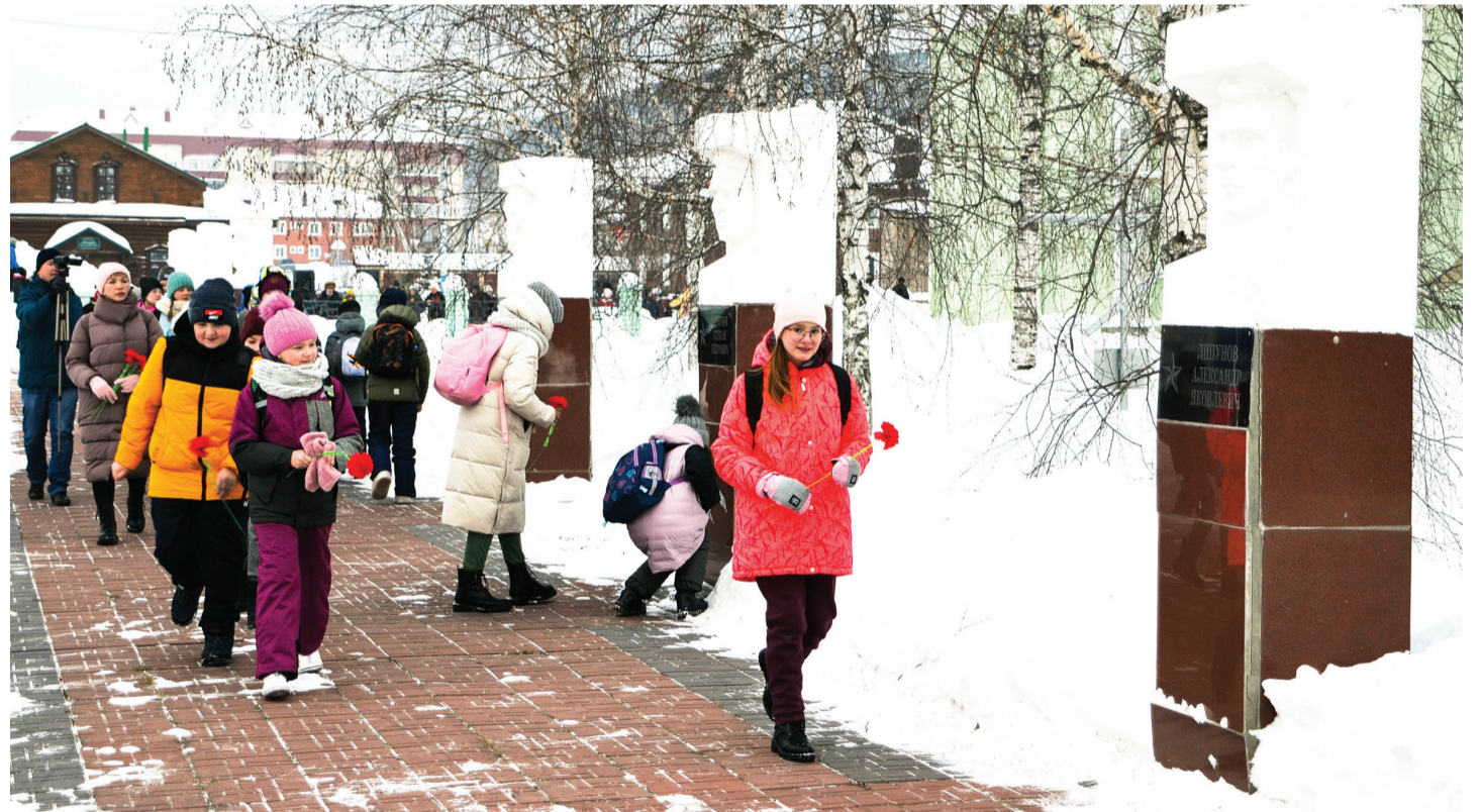
Учащиеся школы № 1 возлагают цветы к барельефам Героев Советского Союза. Фото 2021 г.