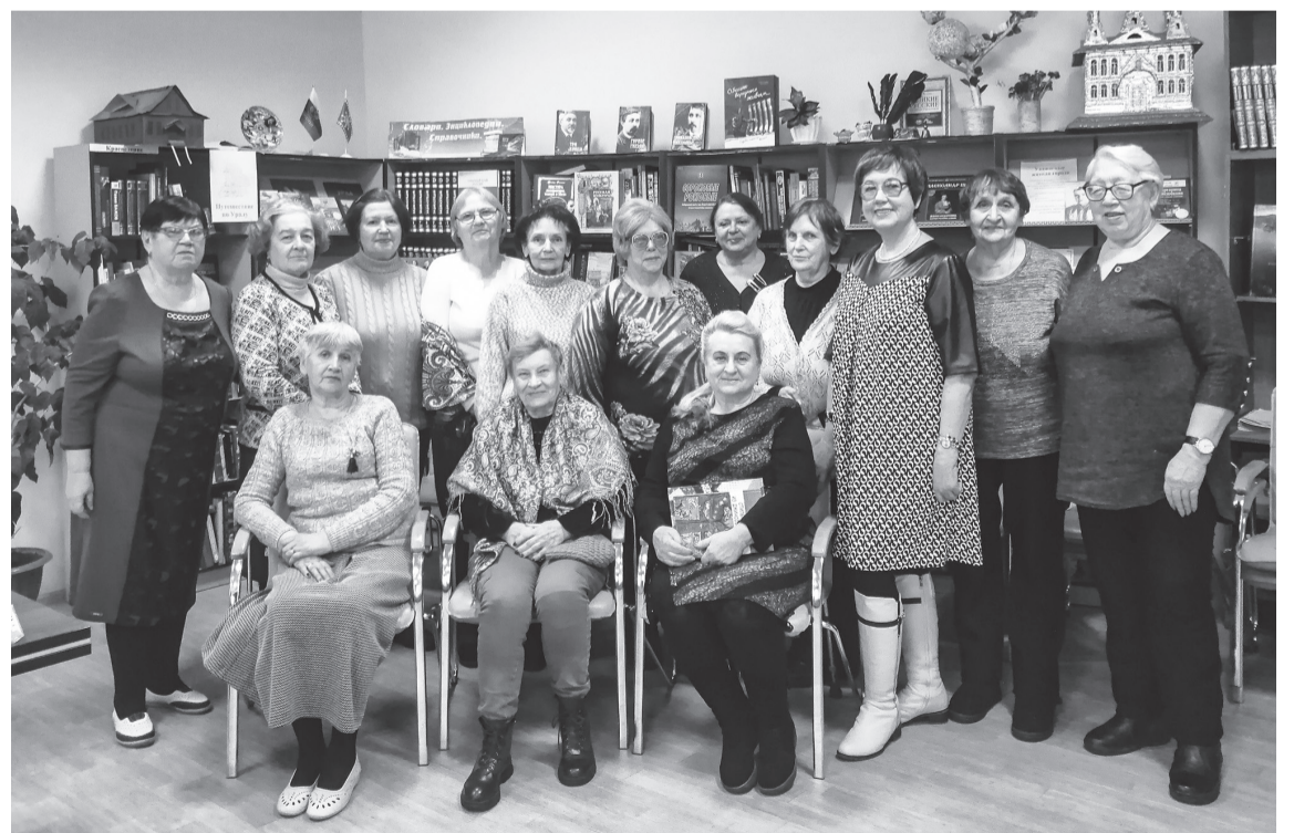
Участницы заседания клуба «Флора»

Первая страница посвящалась составителю «Толкового словаря живого великорусского