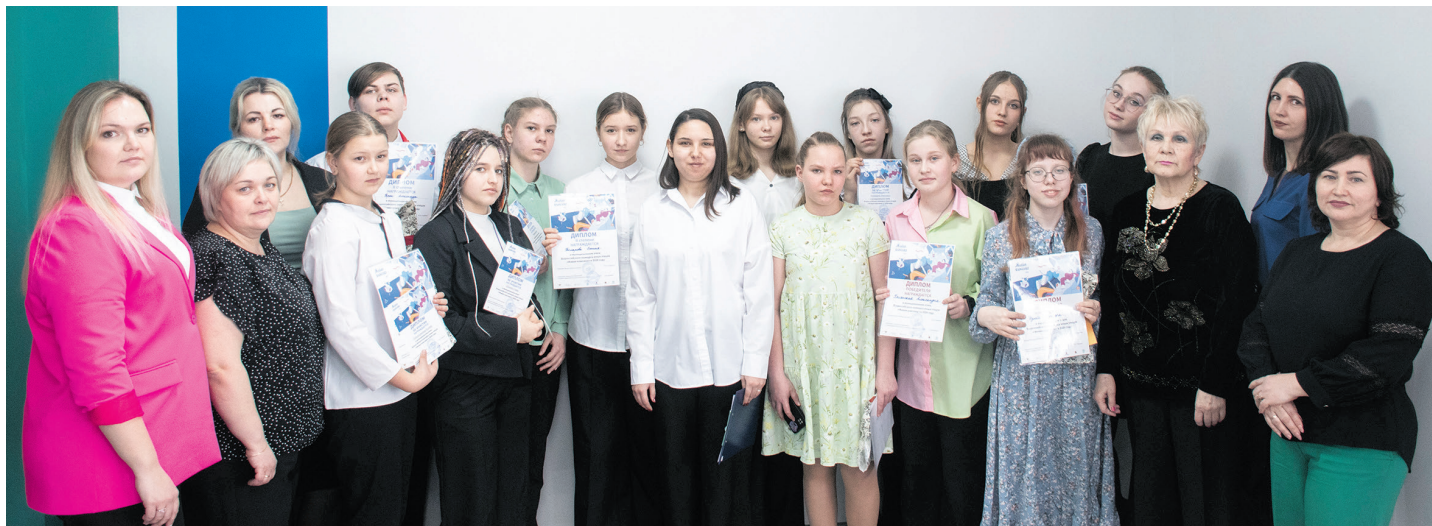
Участники муниципального этапа конкурса "Живая классика"

Артистичные, яркие, креативные, уверенные в себе – именно такими представили себя участники муниципального этапа конкурса юных чтецов "Живая классика-2024", который прошёл 19 марта в городской библиотеке им. М. К. Анисимковой. Участники читали отрывки из любимых литературных произведений в прозе. Это как театр одного актёра, где присутствуют все законы жанра: экспозиция, разработка и кульминация.