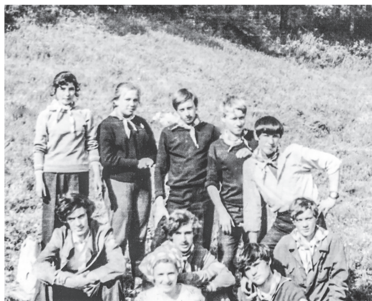
Поход на Шемурский хребет. 1974-1975 г.