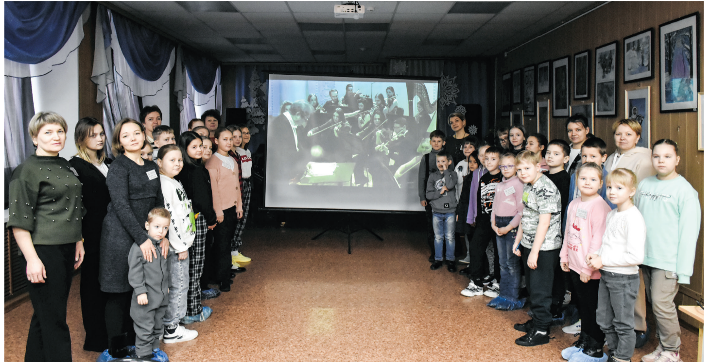
Виртуальный концертный зал в Детской школе искусств

Постоянными слушателями филармонических уроков в Ивдельской детской школе искусств стали не только учащиеся музыкального, но и хореографического, и художественного отделений. К примеру, ученицы 2 класса хореографического отделения очень бой-