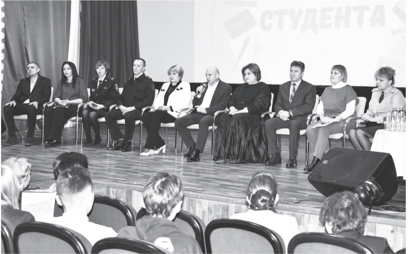
Участники студенческого Форума

Этот праздник пришёлся на День мученицы Татианы Римской, а потому известен ещё и как Татьянин день. Празднуется он широко по всей нашей стране, и в больших и малых городах, а тем более в тех, где есть сами студенты. А в нашем, не сказать, чтобы густонаселённом городе, их много!