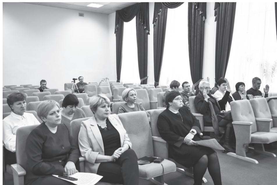
Идет заседание Думы