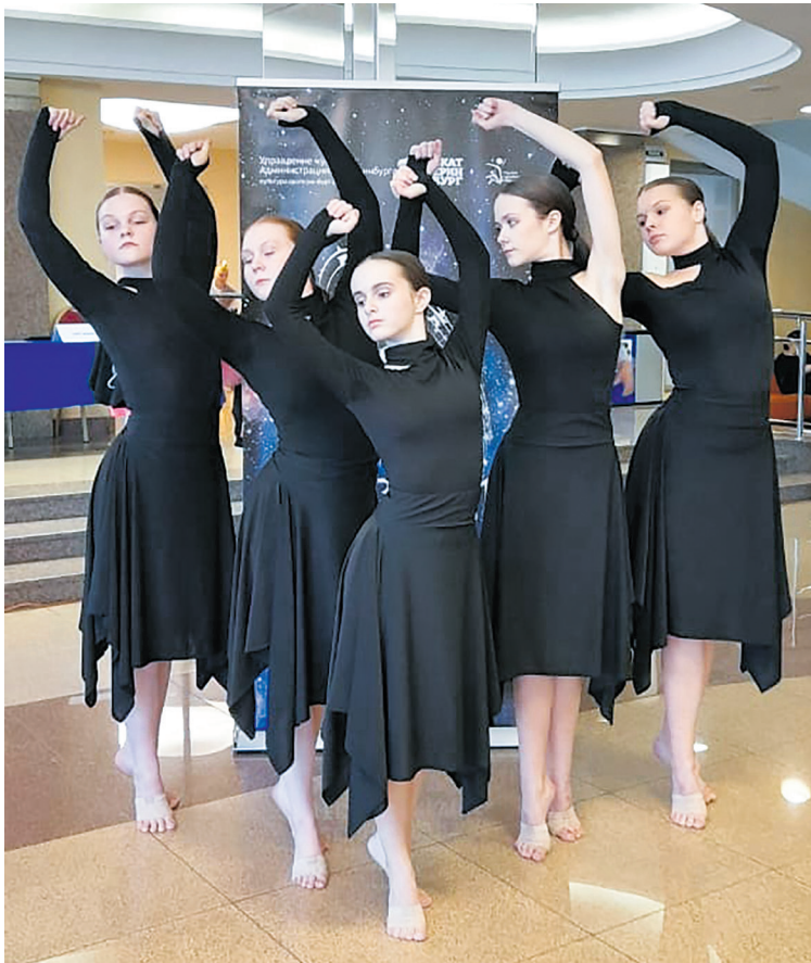
Учащиеся выпускного класса коллектива «Настроение»

Следом за юными музыкантами столицу Урала посетили учащиеся отделения «Хореографическое искусство», принявшие участие в танцевальном марафоне IX Международного детско-юношеского фестиваля хореографического творчества «Звездный дождь». В течение трех дней, с 21 по 23 февраля, в городе Екатеринбурге также на площадке Центра культуры «Урал» проходил этот хореографический проект. Его организаторы: Детская школа искусств № 5, Управление культуры администрации г. Екатеринбурга и Городской ресурсный центр «Хореографическое искусство».