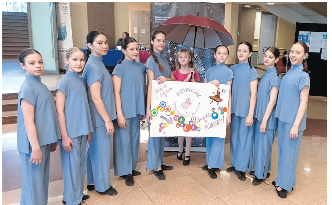
Хореографический коллектив «Настроение»