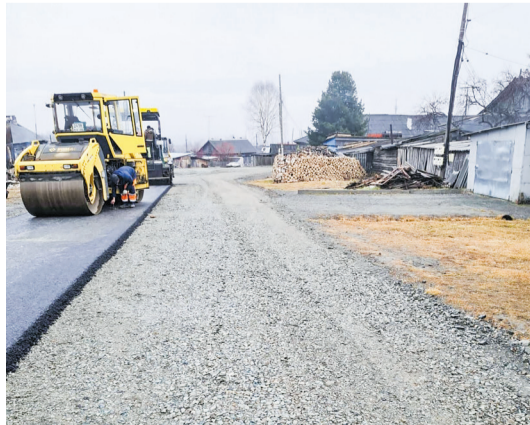
Асфальт на Полуночном и у детского сада № 42