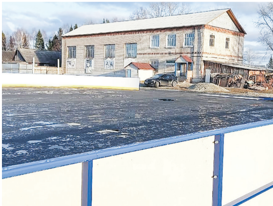
Хоккейный корт в Ивделе-2

НОВЫЙ асфальт появился на улице Химиков в микрорайоне Ивдель-4. Завершение работ по ремонту улицы планируется на последние числа октября. Заасфальтировали и дорожку к детскому саду № 42, так как это место постоянно подтапливается в период дождей и таяния снега.