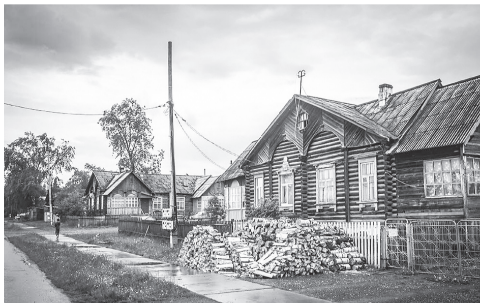
Жилые дома Полуночного, построенные по проекту Всеволожского