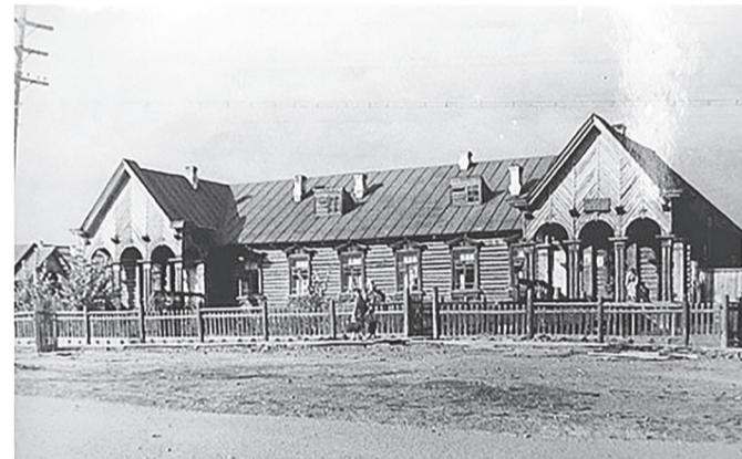
Поселковая больница. 1944 г.

сёлку возникнуть и гармонично развиваться. Все здания посёлка выдержаны в едином, авторском стиле. Здесь нет помпезной монументальности сталинского ампира, присущей архитектуре того времени. Нет и ощущения «временности» и «простоты» построек для маленького рабочего посёлка. Несмотря на то, что посёлок Полуночное рождался в суровые военные годы при дефиците времени и материалов, архитектор сумел воплотить в его градостроительных и объёмных решениях собственные представления об архитектурном ансамбле, обладающим стилистическим и композиционным единством, перекликающимся с образами и традициями деревянного зодчества Русского Севера.