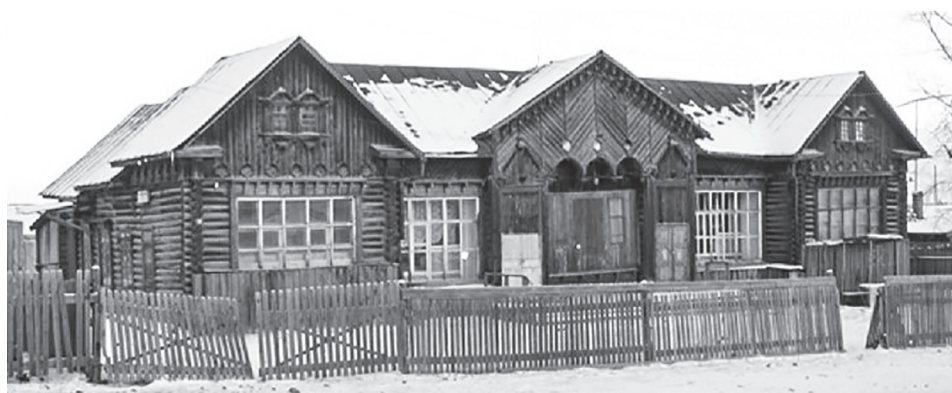
Продуктовый магазин. Построен в 1943 г.