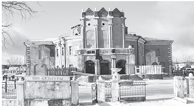
Дом культуры им. Жданова