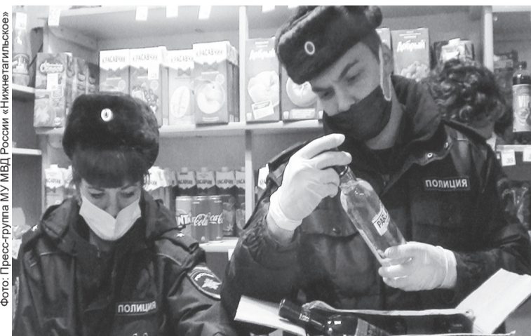
Изъятие контрафактного алкоголя