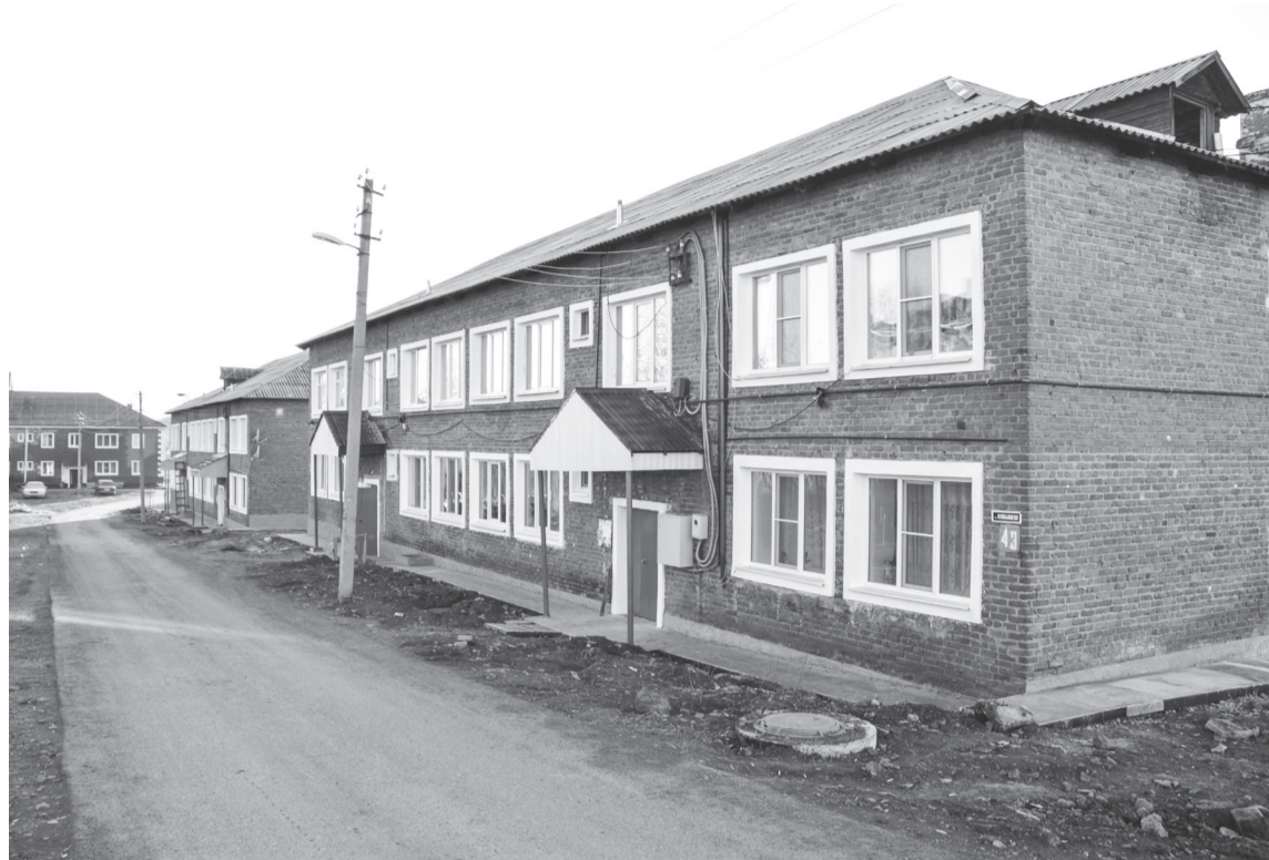
Ремонтируемые дома на ул. Куйбышева

Как уже сообщалось, в 2021 году капитальный ремонт охватил более тысячи многоквартирных домов в 69 муниципалитетах области. По данным фонда, к 12 октября целевые показатели по ремонту крыш выполнены на 88 процентов, фасадов – на 85 процентов, подвальных помещений – на 75 процентов, систем