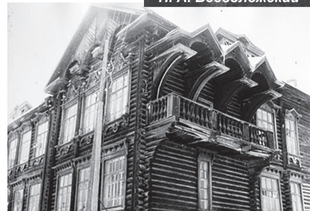
Средняя школа. Общий вид и фрагмент фасада. 1944 г.