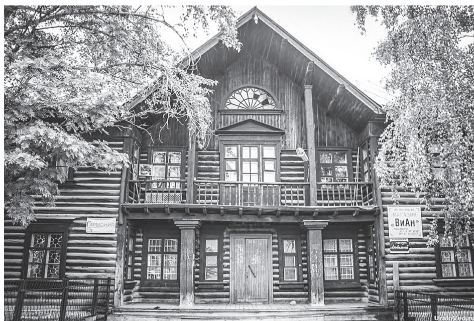
Одно из общественных зданий