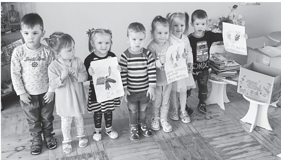
Дети детсада № 2 подготовили рисунки и подарки для отправки детям Донбасса