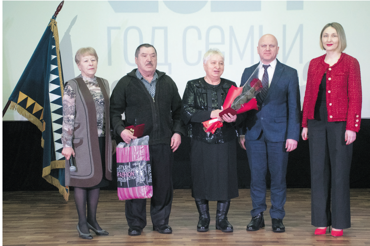
Награждение семьи Пьянковых

Указом президента России Владимиром Путиным 2024