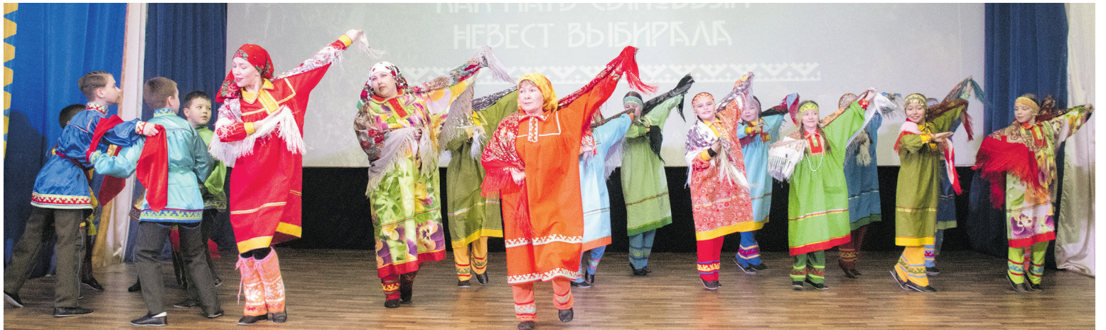
Премьера мансийского танца "Как мать сыновьям невест выбирала"