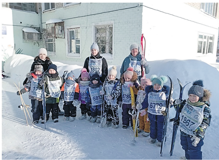
Лыжники д/с п. Оус