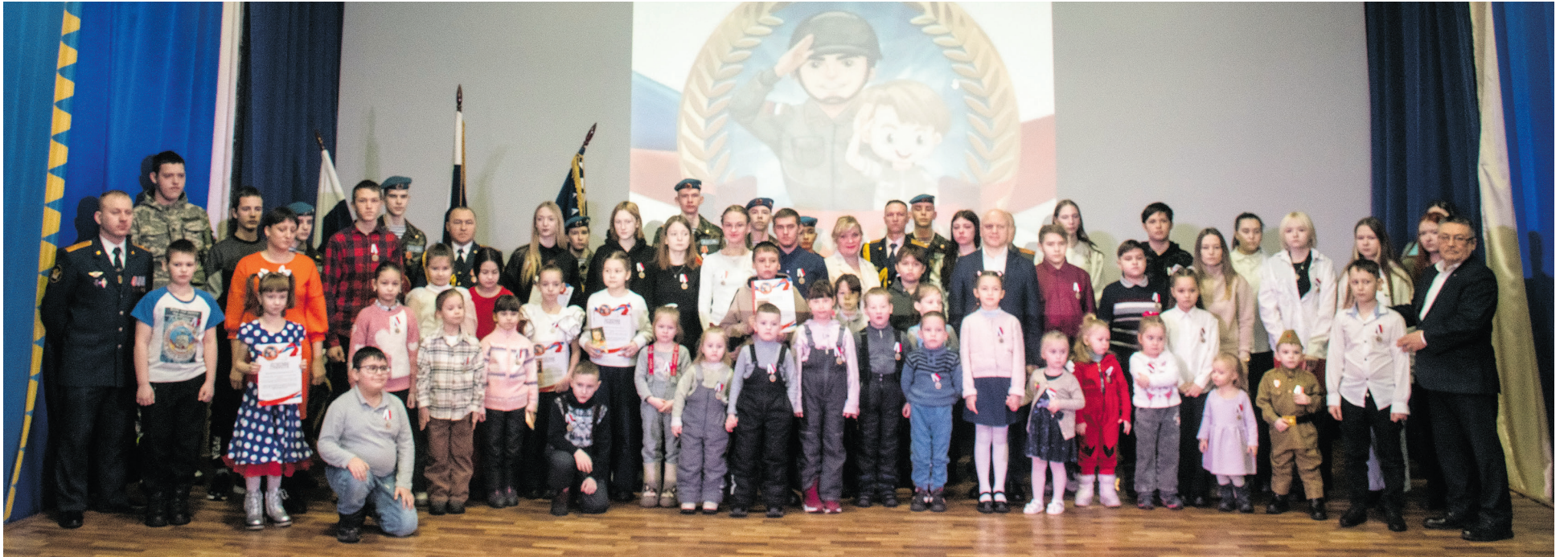
Участники торжественного мероприятия

Каждый ребенок, без сомнения, гордится своими родителями. Ведь для маленького человечка – это опора, защита, поддержка, без которой чувствуешь себя неуверенно и опустошенно. Все потому, что ребенок себя и родителей видит, как единое целое. Достижения родителя окрыляют детей, заряжают уверенностью и гордостью за самого родного человека.