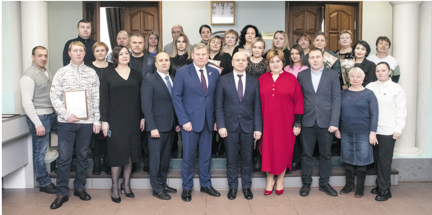
Участники торжественного собрания по случаю Дня профактивиста

106 лет назад работающие уральцы объединились, чтобы отстаивать свои законные права. Базовые требования и в веке 21-м остались неизменными: «Защита. Занятость. Зарплата». Сегодня мы «Гордимся Прошлым. Боремся за