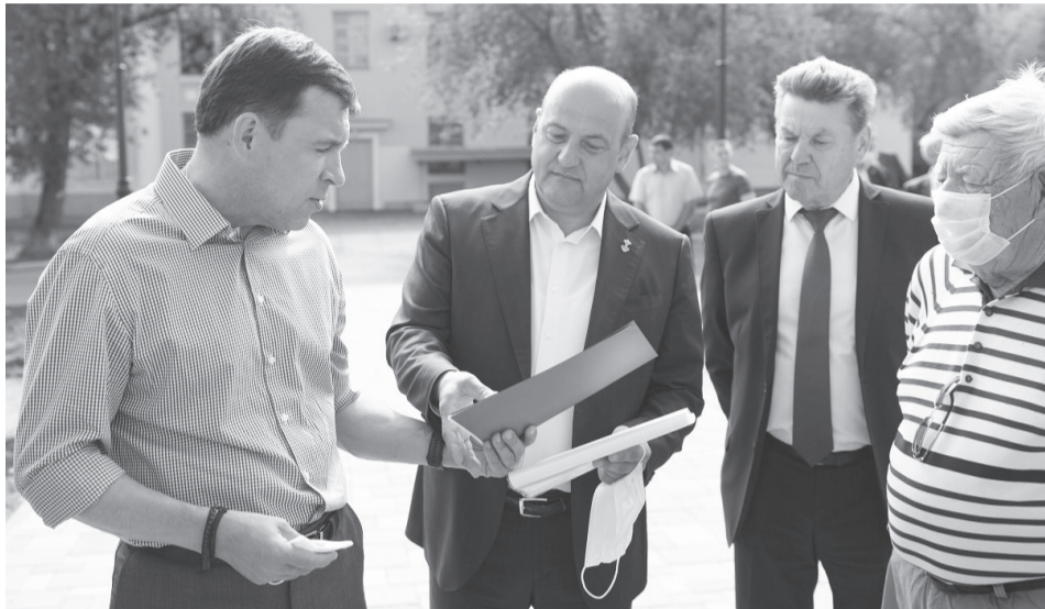
Евгений Куйвашев вручает очередную «взрывпакет»

Евгений Куйвашев 27 августа во время рабочей поездки в Полевской в микрорайоне Зелёный бор встретился с местными жителями, чтобы обсудить возможности, связанные со строительством здесь новой школы. А также оценил перспективы воплощения в жизнь других проектов развития городского округа.