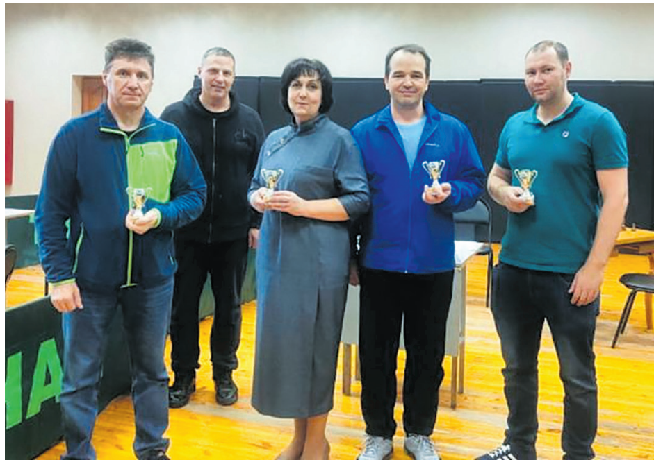
Команда Ивдельского ЛПУМГ

Что такое интеллектуальные игры знают, наверное, все. Чтобы в них играть, необходимо применить умственные способности для достижения победы или в целях проведения досуга. В таких играх развиваются интеллект и эрудиция.