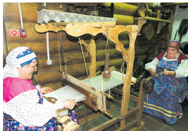
В Ивдельском историко-этнографическом музее

Ранее в перечень мест традиционного бытования народных художественных промыслов Свердловской области были включены Екатеринбург, Нижний Тагил, Сысерть, Алапаевск, Туринск,