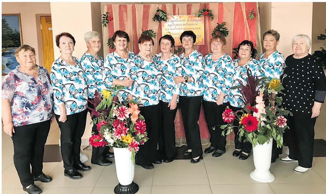
Участники мини-клуба "Русская песня"

селковой библиотеки, душа нашей компании. Песни не просто подбирались, а инсценировались, устраивались целые мини-спектакли. Наши талантливые женщины не хуже артистов справлялись со своими ролями. Проводилось много тематических вечеров, таких как «Праздник русско-