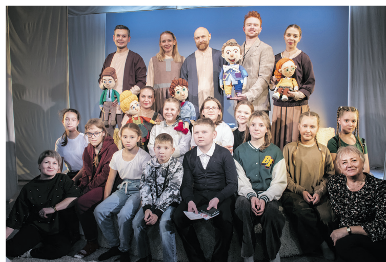
С актёрами Пермского театра кукол

Родители участников вокального ансамбля «Веселые нотки»