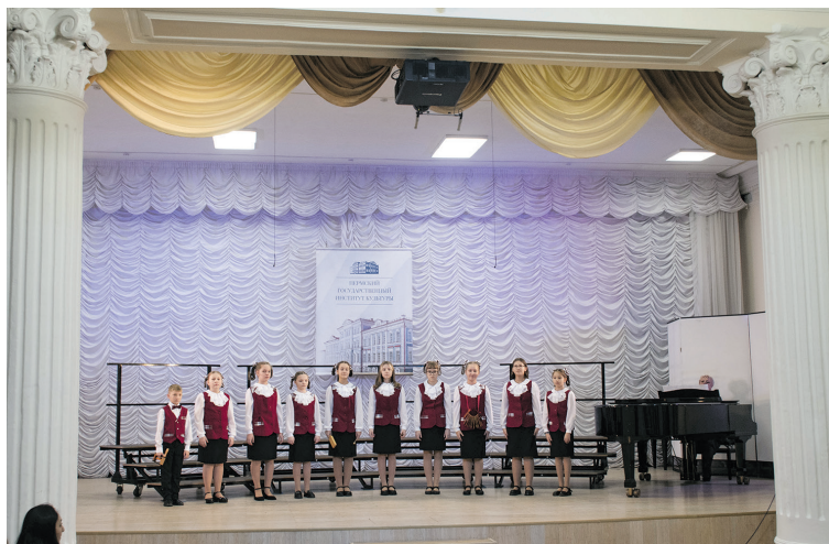
Выступление в колонном зале

В этом конкурсе всего одна номинация – «Вокально-хоровое искусство» (подноминации – «Академический вокал», «Эстрадный вокал», «Народный вокал»). Однако собрал он более 2000 представителей системы непрерывного художественного образования, любительского и профессионального сообществ из Перми и Пермского края, Санкт-Петербурга и Ленинградской области, Удмуртии, Свердловской, Кировской, Ростовской, Кемеровской, Калининградской, Магаданской, Томской, Саратовской областей, Ханты-Мансийского автономного округа и Таджикистана.