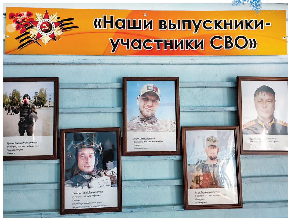
В школе п. Маслово

Рассказал, что в Масловской школе представители педагогического коллектива организовали уголок, посвя-